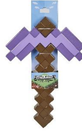
マイクラフト ロールプレイ エンチャントされたツルハシ