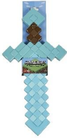
マイクラフト ロールプレイ ダイヤモンドの剣

ゲーム上に登場し、マイクラフトファンなら誰もが知っているアイテム「ダイヤモンドの剣」と「エンチャントされたツルハシ」。 お子さまのごっこ遊びに最適です。