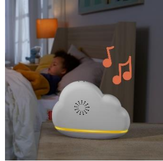
テーブルに置いてメロディと 優しいライトでリラックス