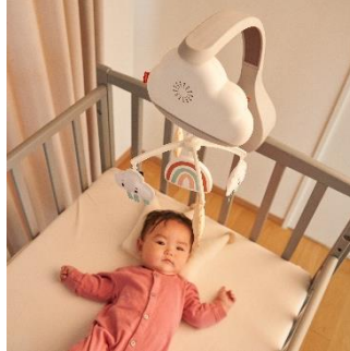
おやすみタイムの赤ちゃんを やさしくあやします