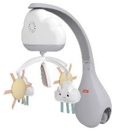
太陽と雲のメリーが ゆっくり回転します

雲の形のメロディボックスの下についた太陽と雲のメリーがくるくる周り、お子さまの良質な睡眠をサポートし、穏やかな睡眠に誘導する商品です。泣き声を感知するとメロディが自動的に流れるお目覚めグズグズセンサーとソフトライトで、睡眠へ促します。メロディは専門家がセレクトした、フランス民謡の「かねがなる」やバッハ「無伴奏チェロ組曲第1」など全13曲が収録されているので、幅広い曲からその時に合った曲を選択いただけます。また、成長した後は雲の形のメロディボックスを取り外し、リラックスメロディボックスとしてご使用いただける2WAY仕様です。さらに、最大幅4.1cmで垂直に取り付けられる場所であれば使用でき、折り畳みベッドや木製ベッドなど多様なベビーベッドに対応しています。