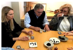
佐賀海苔食べ比べ体験

SAGA COLLECTIVE では世界に誇る「食・伝統・技術」を五感で体験でき、カーボンニュートラルなものづくりについても学べるワークショップを開催。また国内外のバイヤー、シェフ、飲食小売関係者、事業者、SDGs 研究者、教育機関などの視察の受入れを実施しています。