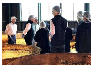
天然醸造の醤油蔵見学