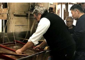
和紙の手すき体験