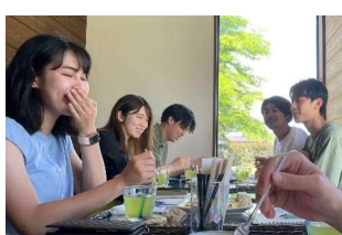
柚子胡椒と粕漬の試食体験