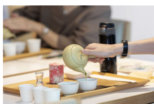
嬉野茶の味と香りの体験