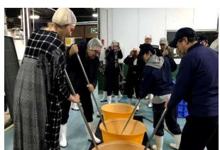
酒蔵で仕込み&試飲体験