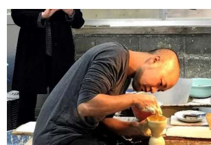
有田焼ろくろ&絵付体験