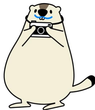
モトムットキャラクター マーモットのモットちゃん

ノーコードで採用サイト制作が可能なのでWEBの知識がない方も簡単にページ制作や更新作業ができます。また、ハローワーク等で掲示されているテキスト情報だけでは伝えきれない求人情報を、独自の取材や撮影で企業の素顔を深掘りし、職場の魅力ある雰囲気とともに伝えるために採用サイト制作の代行もおこなっています。