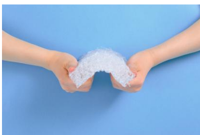
①復元性（体重を押し返す力）が高く睡眠時の寝返りがスムーズ