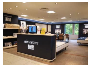
全国各地に次々と新店舗がOPEN!

快適な寝心地が評価され、トップアスリート、JAL国際線ビジネスクラスファーストクラスをはじめ、石川県和倉温泉「加賀屋」全室等様々な採用実績があります。