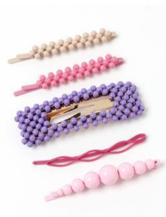
(右)・ヘアピン5コセット ¥2,090(税込)