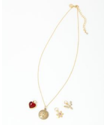
(左)・セットネックレス ¥2,090(税込)