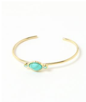
(左)・バングル ¥2,090(税込)