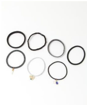
(中)・チャーム付きヘアゴム ¥2,090(税込)