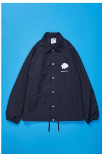
コーチジャケット