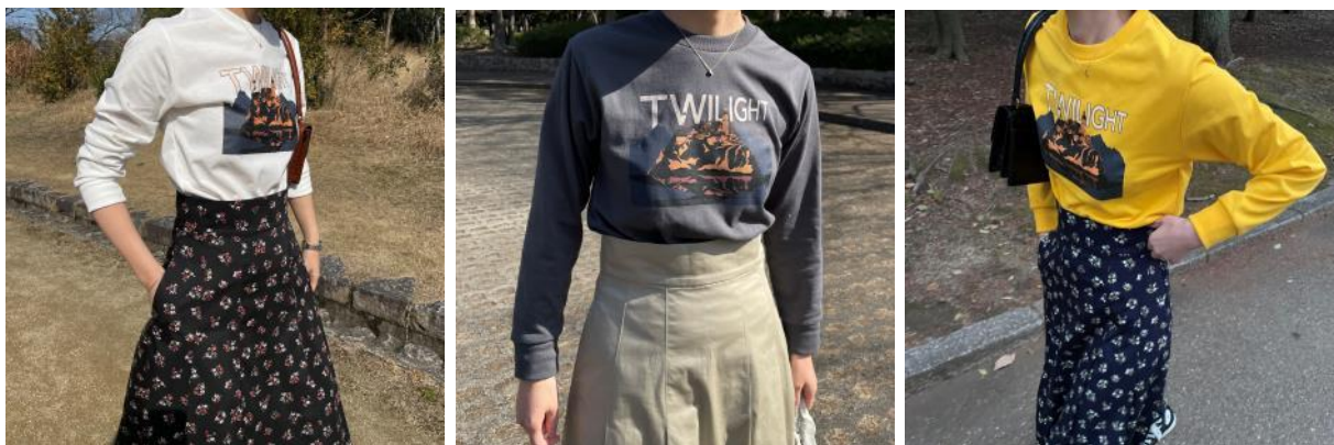
・ プリントTシャツ ¥4,290(税込)