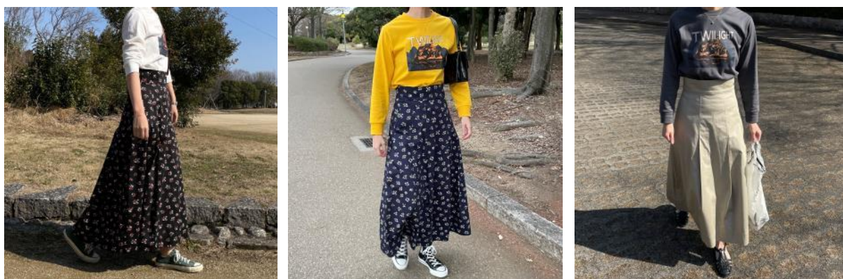
・ プリーツスカート ¥6,490(税込)