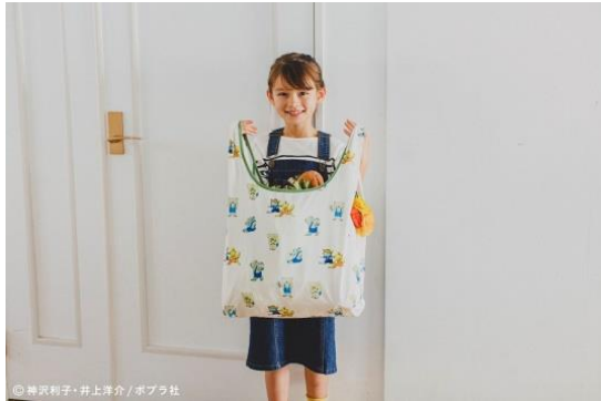
・エコバッグ ¥2,200(税込)