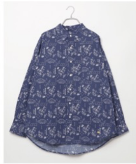
オリックス・バファローズ