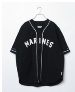
千葉ロッテマリーンズ