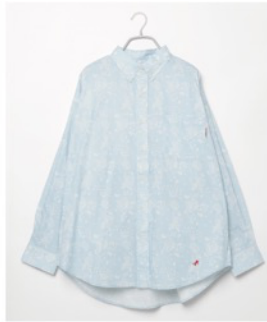
埼玉西武ライオンズ