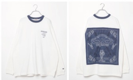
オリックス・バファローズ