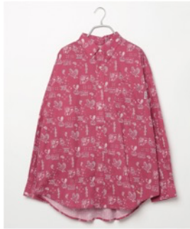
東北楽天ゴールデンイーグルス