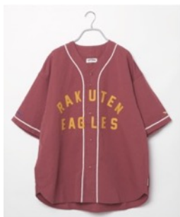
東北楽天ゴールデンイーグルス