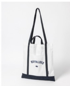
オリックス・バファローズ