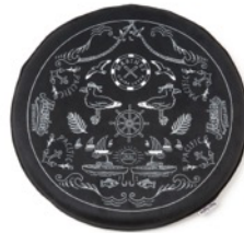
千葉ロッテマリーンズ