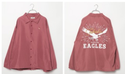
東北楽天ゴールデンイーグルス