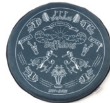
オリックス・バファローズ