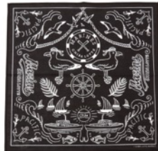
千葉ロッテマリーンズ