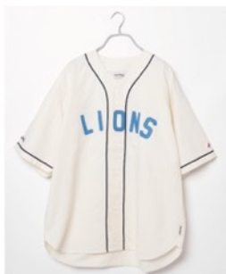
埼玉西武ライオンズ