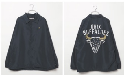
オリックス・バファローズ