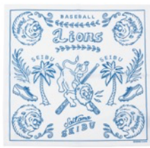
埼玉西武ライオンズ