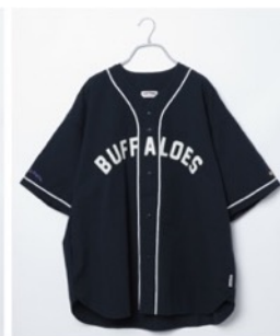
オリックス・バファローズ