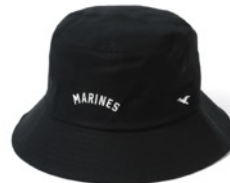
千葉ロッテマリーンズ