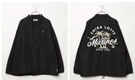
千葉ロッテマリーンズ