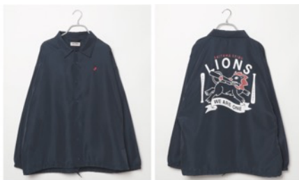
埼玉西武ライオンズ