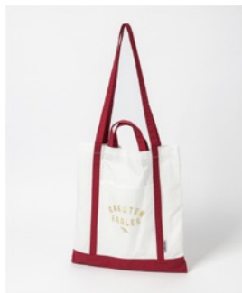
東北楽天ゴールデンイーグルス