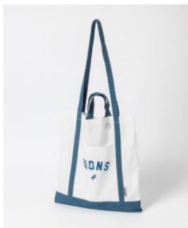
埼玉西武ライオンズ