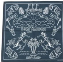
オリックス・バファローズ