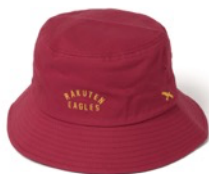
東北楽天ゴールデンイーグルス