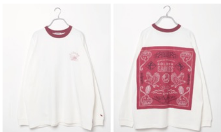
東北楽天ゴールデンイーグルス