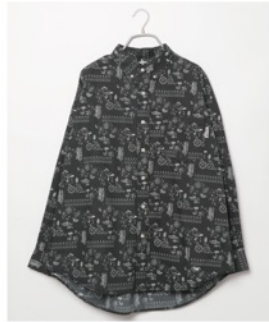
千葉ロッテマリーンズ