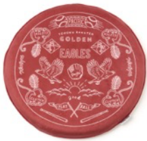
東北楽天ゴールデンイーグルス