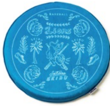
埼玉西武ライオンズ