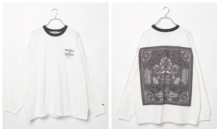
千葉ロッテマリーンズ