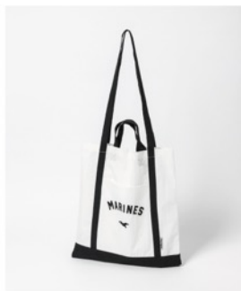
千葉ロッテマリーンズ