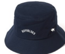
オリックス・バファローズ