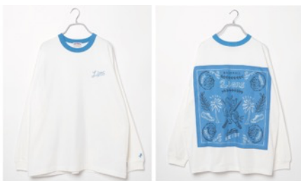
埼玉西武ライオンズ