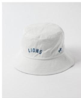
埼玉西武ライオンズ