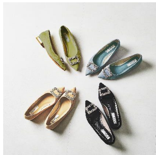
NICAL ビジューモチーフパンプス 11,000 円(税込) カラー：ベージュ・ブラック・ブルー・グリーン サイズ：34(22.0cm)～41(25.5cm)