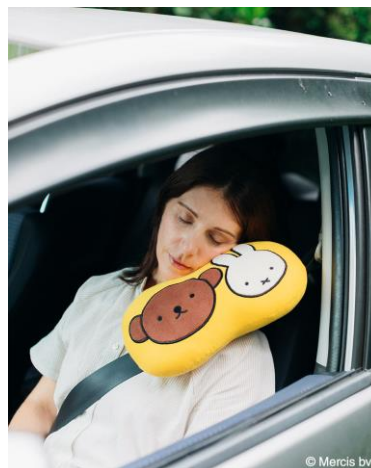
・シートベルトクッション ¥2,200(税込)