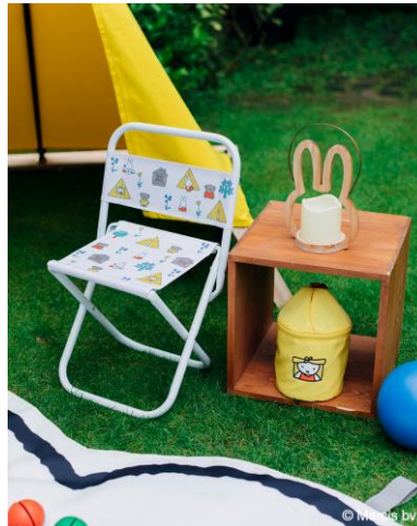
・折り畳みチェア ¥3,080(税込) ・ウッドランタン ¥2,750(税込) ・マルチダストボックス ¥1,980(税込)