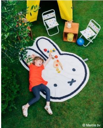
・ダイカットレジャーシート ¥4,620(税込)