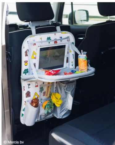
・バックシートポケット ¥6,600(税込)