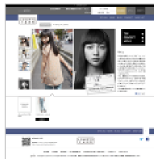
<特設サイトイメージ>

WEB ストア URL : http://www.point.jp/lowrystfarm/