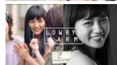
<TVCM・ムービーイメージ>