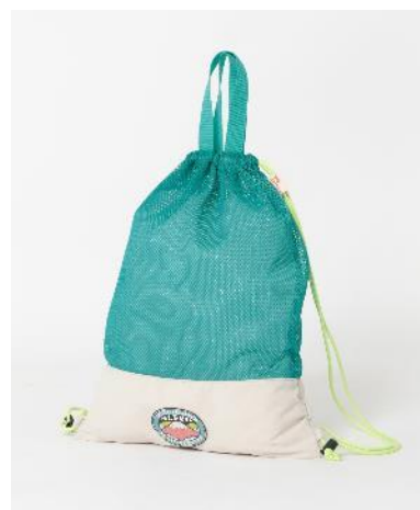
商品名：メッシュナップサック 価格：2,420 円（税込） カラー展開：ブルー サイズ：フリー