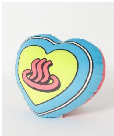
商品名：モチモチクッション 価格：2,750 円（税込） カラー展開：ブルー サイズ：フリー

湯船に浮かぶラバー・ダックや銭湯のタイルをデザインに落とし込んだ雑貨を展開します。