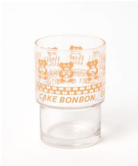
商品名：スタッキンググラス 価格：990円(税込) カラー展開：01：ボンボン サイズ：フリー

ノスタルジックな雰囲気が漂う外観をプリントしたフォトTシャツや、トレードマークのくまのキャラクターをモチーフにした雑貨を展開します。