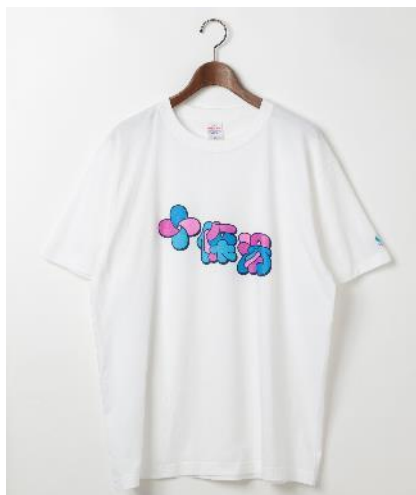
商品名：十條湯カニティ 価格：5,500 円（税込） カラー展開：ライトグリーン・ライトブルー サイズ：M・XL

十條湯のガラガラステッカーをフロントに落とし込み、袖には浴室のカニモチーフの刺繍を施したTシャツを限定コラボレーション、また十條湯を象徴とする、目を引く看板ロゴをデザインに落とし込んだTシャツを展開します。