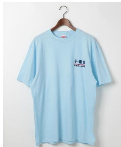
商品名：十條湯サインティ 価格：4,950 円（税込） カラー展開：ホワイト・ライトブルー サイズ：M・XL