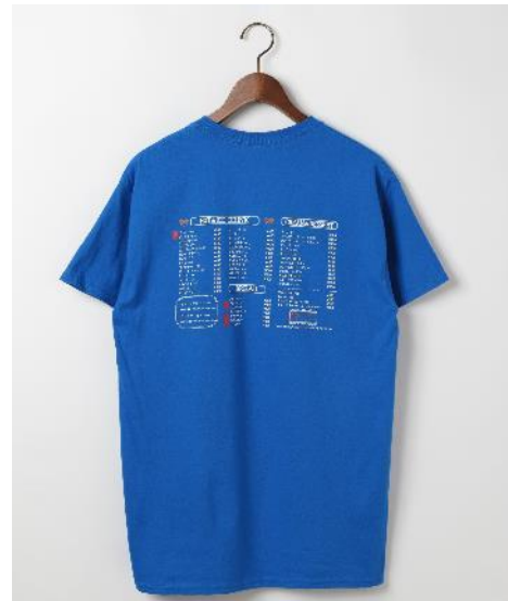
商品名：ボンボンメニューティ 価格：5,500円(税込) カラー展開：ホワイト・ブルー サイズ：M・XL