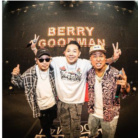
ベリーグッドマン