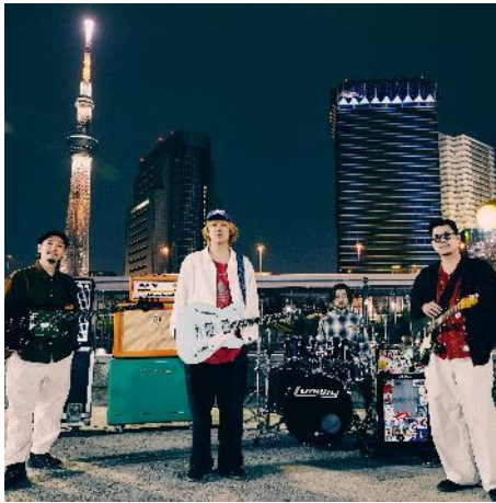
YONA YONA WEEKENDERS