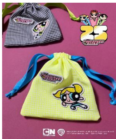
【パワーパフ ガールズ】巾着ポーチ / ¥2,490 / サイズ：FREE / カラー： Blossam、Buttercup、Bubbles