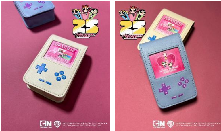
【パワーパフ ガールズ】リップポーチ / ¥2,990 / サイズ : FREE / カラー : ホワイト,ブルー