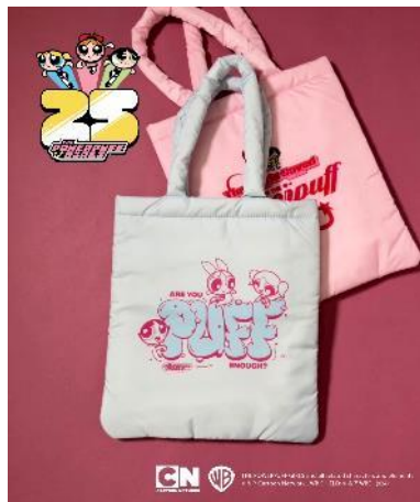
【パワーパフ ガールズ】トートバッグ / ¥3,990 / サイズ：FREE / カラー：ネイビー、ピンク、ライトブルー