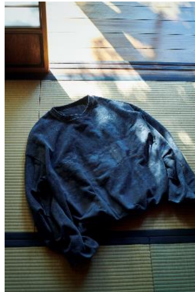
商品名：アートプリントピグメントPO 価格：14,960円(税込) カラー展開：ブラック サイズ：Free