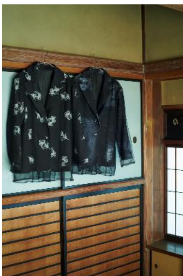
商品名：シアレイヤードジャケット 価格：19,800円(税込) カラー展開：ブラック、グレー サイズ：Free