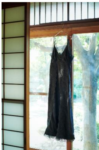
商品名：ガラーススリットキャミOP 価格：15,950 円（税込） カラー展開：ブラック サイズ：Free