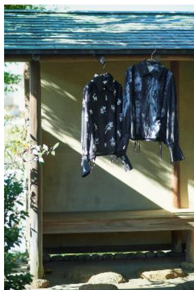
商品名：レースアップショートシャツ 価格：13,970円(税込) カラー展開：ブラック、グレー サイズ：Free