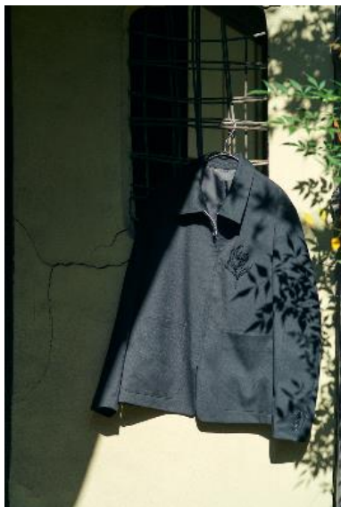
商品名：バックプリントジャケゾン 価格：22,000円(税込) カラー展開：ブラック サイズ：Free