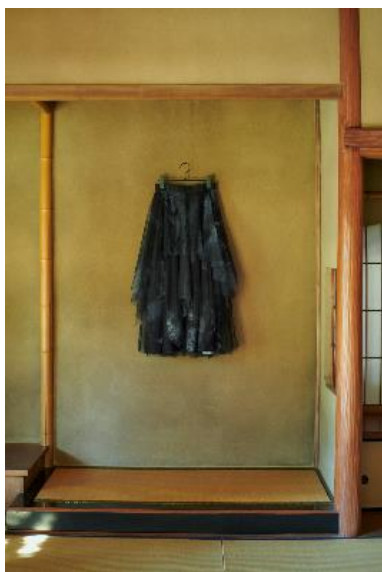
商品名：チュールレイヤースカート 価格：19,800 円（税込） カラー展開：ブラック サイズ：Free