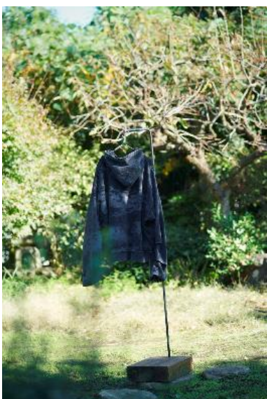
商品名：アートプリントピグメントZIPパーカー 価格：16,940円(税込) カラー展開：ブラック サイズ：Free