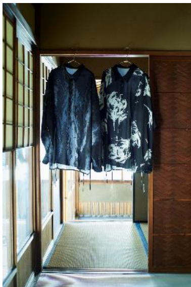
商品名：パイピングシャツ 価格：13,750円(税込) カラー展開：ブラック、グレー サイズ：Free