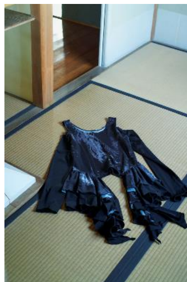
商品名：フリルレイヤードデザインカットソー 価格：11,880 円（税込） カラー展開：ブラック サイズ：Free