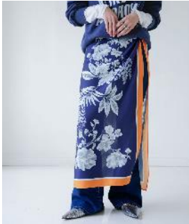
商品名 : 【eL×ONE】Flower Large Scarf 価格 : ¥ 8,800(税込)