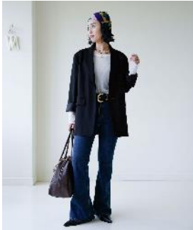
商品名 : 【eL×ONE】Tight Flare Denim Pants 価格 : ¥ 13,200(税込)