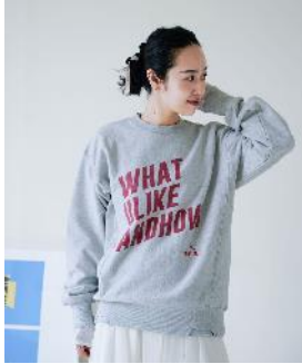
商品名 : 【eL×ONE】Logo Sweat Pullover 価格 : ¥ 12,100(税込)