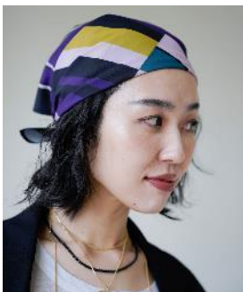
商品名 : 【eL×ONE】Multi Stripe Small Scarf 価格 : ¥ 5,500(税込)