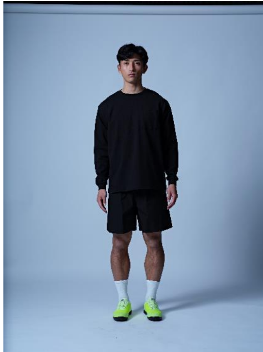
トップス : Comfort Ast Long-sleeve T KAMO 価格 : 6,490 円 (税込) カラー展開 : ホワイト、ブラック サイズ展開 : M,L,XL ボトムス : Clean Ripstop Shorts KAMO 価格 : 6,050 円 (税込) カラー展開 : カーキ、ブラック サイズ展開 : M,L,XL