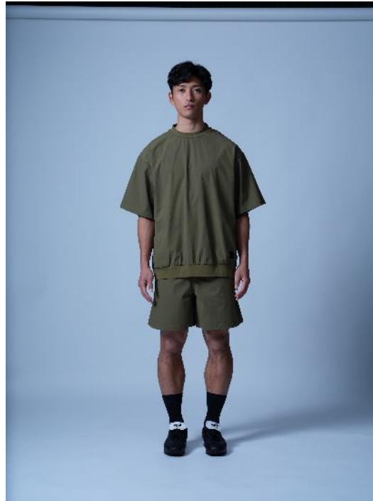
トップス : Clean Ripstop T-shirts KAMO 価格 : 7,590 円 (税込) カラー展開 : カーキ、ブラック サイズ展開 : M,L,XL ボトムス : Clean Ripstop Shorts KAMO 価格 : 6,050 円 (税込) カラー展開 : カーキ、ブラック サイズ展開 : M,L,XL