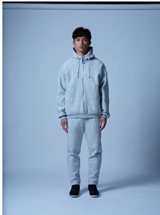
トップス : Cool Thic Hoodie KAMO 価格 : 9,350 円 (税込) カラー展開 : グレー、ブラック サイズ展開 : M,L,XL ボトムス : Cool Thic Pants KAMO 価格 : 7,700 円 (税込) カラー展開 : グレー、ブラック サイズ展開 : M,L,XL