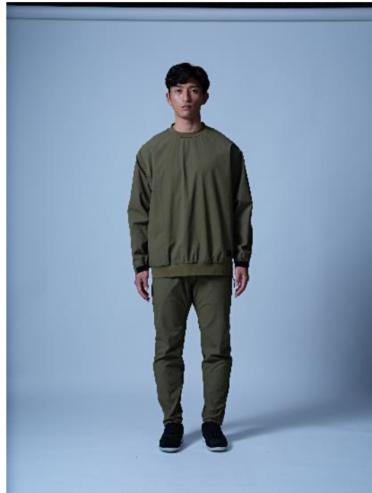
トップス : Clean Ripstop Long-sleeve T KAMO 価格 : 8,690 円 (税込) カラー展開 : カーキ、ブラック サイズ展開 : M,L,XL ボトムス : Clean Ripstop Pants KAMO 価格 : 8,690 円 (税込) カラー展開 : カーキ、ブラック サイズ展開 : M,L,XL