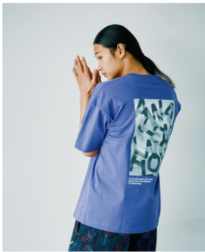
レイヤーグラフィック TEE