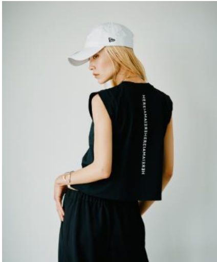
ミラーロゴショートプルオーバー