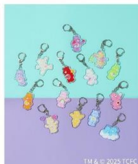
商品名：ランダムチャーム 価格：690 円（税込） カラー：全 16 種（14 種＋シークレット 2 種）