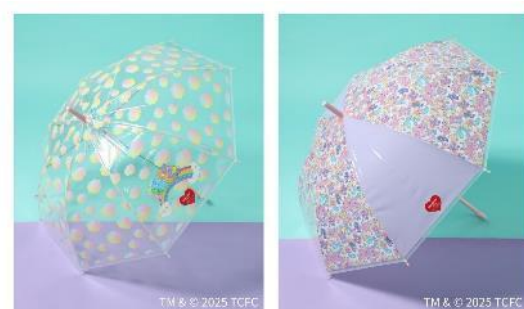
商品名：ビニール傘 価格：1,790 円（税込）