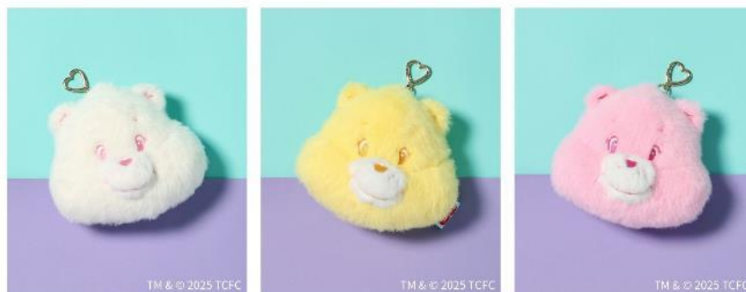
商品名：キャラクターポーチチャーム 価格：2,490 円（税込） カラー展開：ホワイト／イエロー／ピンク