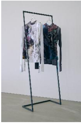
商品名：MK/ 2 Pカットソー 価格： ¥ 9,900（税込）