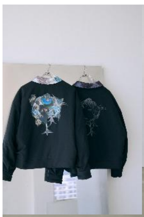
商品名：MK/リバーシブルブルゾン 価格： ¥ 22,000（税込）