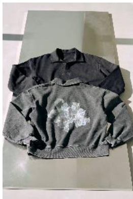
商品名：MK/スキップースウェット 価格： ¥ 12,980（税込）