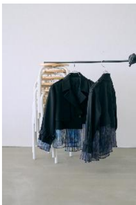
商品名：MK/レイヤードトレンチ 価格： ¥ 22,000（税込）