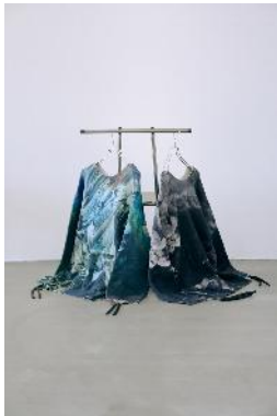
商品名：MK/オーバーニットプルオーバー 価格： ¥15,940（税込）