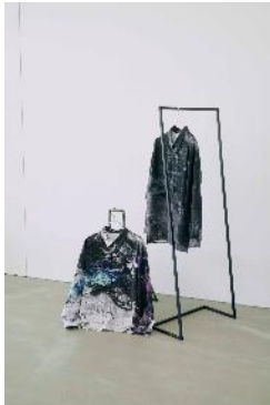
商品名：MK/シアレイヤードシャツ 価格： ¥13,970（税込）