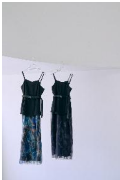
商品名：MK/ペプラムバルーンワンピース 価格： ¥ 19,800（税込）