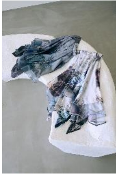
商品名：MK/イレヘムスカート 価格： ¥18,700（税込）