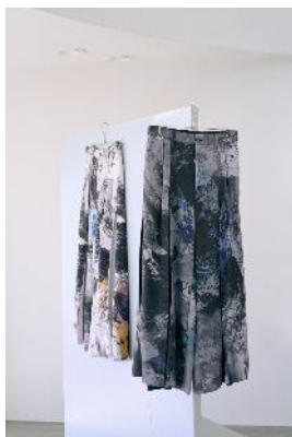
商品名：MK/HAKAMAガラパンツ 価格： ¥ 15,400（税込）