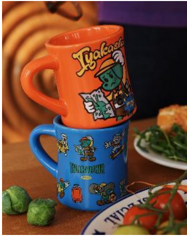
商品名：マグカップ 価格：1,650 円（税込） カラー展開：ブルー/オレンジ