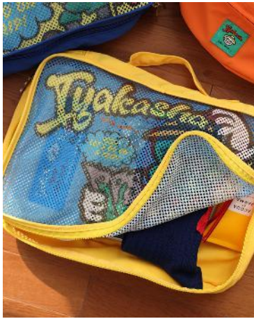
商品名：リコウブクロL 価格：2,200 円（税込） カラー展開：イエロー ※海外店舗では、一部取扱商品が異なる場合がございます。