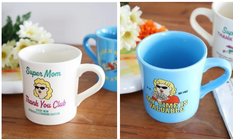
商品名：マグカップ 価格：1,430 円（税込） カラー展開：アイボリー / ブルー

柔らかい印象の丸みのあるフォルムとぽってりとした厚さで、持ちやすさも抜群なマグカップ。 お家やオフィスなど、様々なシーンで使えるので贈り物にもおすすめです。