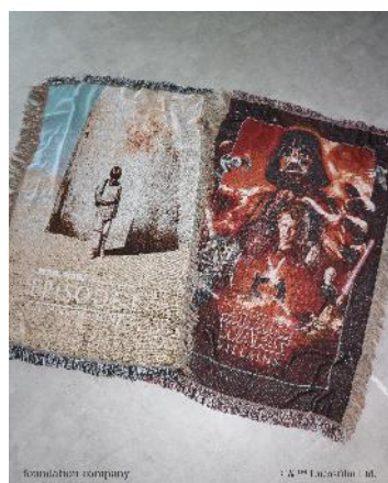
商品名：【STAR WARS】ジャガードストール 価格：9,900 円（税込） カラー展開：ホワイト 05,ブラック 09