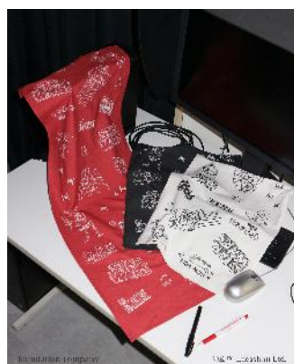
商品名：【STAR WARS】手ぬぐい 価格：2,200 円（税込） カラー展開：ホワイト 02,ブラック 09,レッド 35