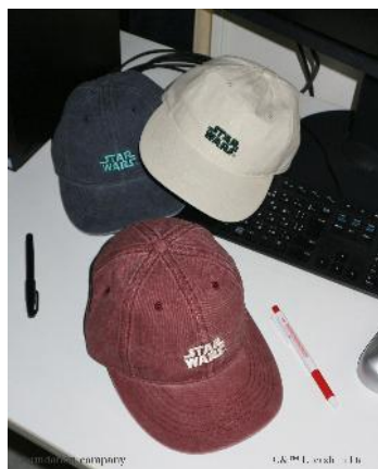
商品名：【STAR WARS】ロゴキャップ 価格：4,490 円（税込） カラー展開：ホワイト 05,レッド 38,ブルー89