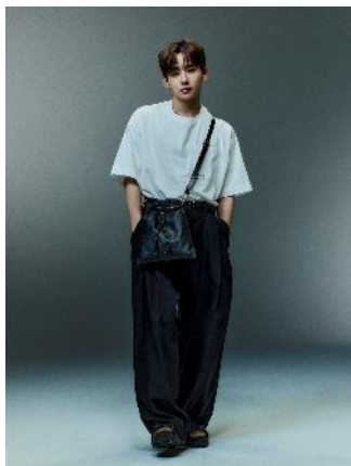
商品名：【ICY FEEL】ポケットミニロゴカット 価格：4,400 円（税込） カラー展開：ホワイト、グレー、ブルー、パープル、ブラック サイズ：S、M