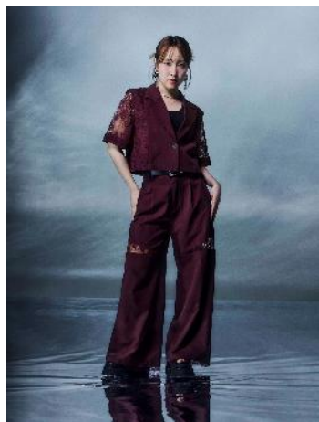
商品名：【ICY FEEL】サスツキポケットカーゴ 価格：17,930 円 カラー展開：パープル、ブラック サイズ：FREE