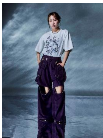
商品名：【ICY FEEL】アートシシュウT 価格：7,920 円（税込） カラー展開：ホワイト、イエロー、ブルーグリーン、ブラック サイズ：FREE