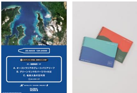
クイズラリー（見本） SATELLITE CRAYON PROJECTのスケッチブック（非売品）

地下1階から2階までの各フロアに設置されたPOPを巡り、その色が地球のどこを指しているかを当てるクイズラリーを実施します。回答いただいたお客さまには、SATELLITE CRAYON PROJECTスケッチブック（非売品）を特典としてプレゼントいたします。※先着順となります。準備数がなくなり次第終了となります。