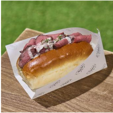
商品名：ローストビーフマウンテンニコパン 価格：1,800 円（税込）

石川県能登町のジェラテリア「マルガーゼラート」の、能登の塩ジェラートを使用したスイーツニコパンです。キャラメルソースが能登の塩を効かせたミルクジェラートの濃厚な甘さを引き立てる、北陸の魅力を感じられる限定メニューとなっております。