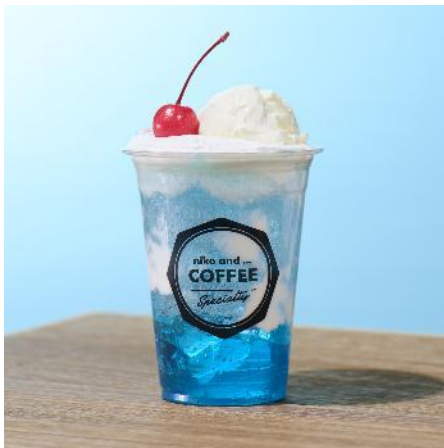
商品名：グラスの中に広がる青空！シュワッと爽快、クリームソーダ

青空をイメージしたクリームソーダに、スカイブルーのゼリーを合わせた遊び心あふれるドリンクです。能登の塩ジェラートとともに、爽やかな味わいをお楽しみいただけます。