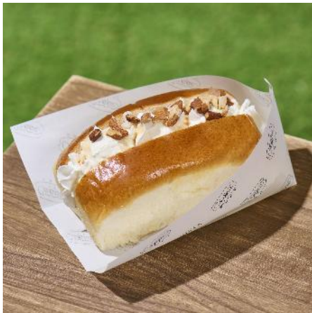
商品名：能登の塩ジェラートキャラメルニコパン 価格：1,200 円（税込）

石川県能登町のジェラテリア「マルガーゼラート」の、能登の塩ジェラートを使用したスイーツニコパンです。キャラメルソースが能登の塩を効かせたミルクジェラートの濃厚な甘さを引き立てる、北陸の魅力を感じられる限定メニューとなっております。