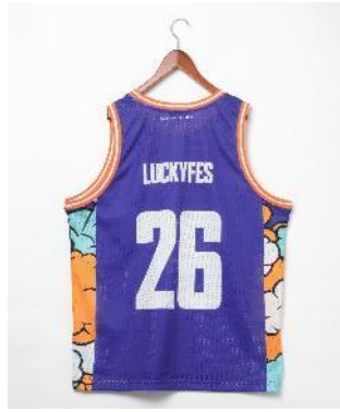
商品名：【LuckyFes'26】茨城ロボッツコラボタンクトップ 価格：4,500 円（税込） カラー展開：ブルー サイズ：フリー