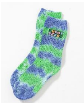
商品名：【LuckyFes'26】タイダイ刺繍ソックス 価格：800円（税込） カラー展開：イエロー、ブルー サイズ：フリー