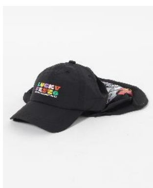
商品名：【LuckyFes'26】サンシェードキャップ 価格：3,500円（税込） カラー展開：ブルー、ブラック サイズ：フリー