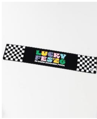
商品名：【LuckyFes'26】マフラータオル 価格：1,500 円（税込） カラー展開：カラフルスプラッシュ、ブラックチェック サイズ：フリー