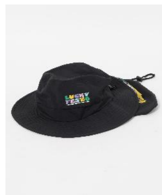
商品名：【LuckyFes'26】サンシェードハット 価格：3,500円（税込） カラー展開：オリーブ、ブラック サイズ：フリー