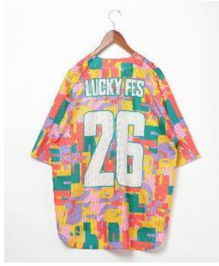
商品名：【LuckyFes'26】ベースボールシャツ 価格：4,500 円（税込） カラー展開：イエロー サイズ：フリー