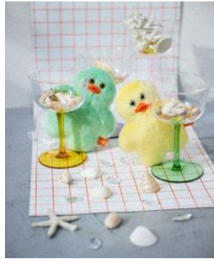
撮り下ろしビジュアル