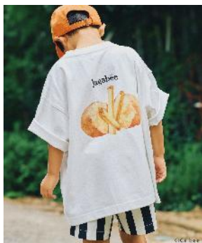
商品名：【KIDS】【Jagabee】アソートTシャツ 価格：3,990 円（税込） カラー展開：オフホワイト／ブラック／ピンク サイズ：130cm

130cmのキッズサイズTシャツ。大人サイズとは違ったプリントがポイントです。親子でのリンクコーデにもおすすめです。