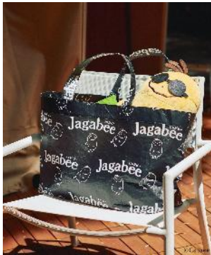
商品名：【Jagabee】レジャー-BAG 価格：2,200 円（税込） カラー展開：ナチュラル/ブラック

総柄の「ポッタ」がポイントのレジャー-BAG。キャンプやBBQ、ビーチなど夏のお出かけにぴったりのアイテムです。容量もたくさん入り、内側にはポケットもついています。