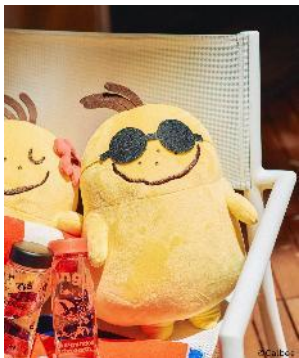
商品名：【Jagabee】ポッタヌイグルミ 価格：4,400 円（税込） カラー展開：ポッタサングラス/ポッタ浮き輪

浮き輪とサングラスを身に着けた「ポッタ」のぬいぐるみ。それぞれ取り外しが可能になっています。インテリアとして飾ってもかわいく、プレゼントにもおすすめです。