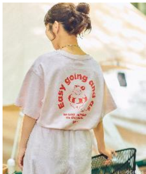
商品名：【Jagabee】アソートTシャツ 価格：4,990 円（税込） カラー展開：オフホワイト／オフホワイト×イラスト／スミクロ／ピンク／ブルー／ブルー×イラスト 1／ブルー×イラスト 2（WEB限定）／ブラック（WEB限定） サイズ：FREE SIZE

浮き輪、トランクに荷物を詰めている「ポッタ」、花火など夏を楽しむ「ポッタ」がプリントされたLEPSIMオリジナルのイラストをプリント。ボトムスを選ばない使いやすいシルエットになっています。