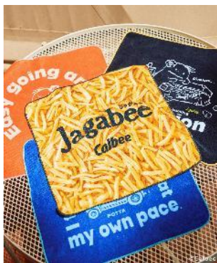
商品名：【Jagabee】ハンドタオル 価格：1,650 円（税込） カラー展開：Jagabee／ブラック／レッド／ブルー

A4 サイズが入る使いやすいトートバッグです。「ポッタ」のアソートイラスト、Jagabee、Calbeeのロゴがポイントになっています。