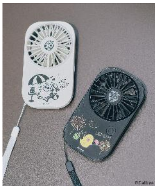
商品名：【Jagabee】ハンディファン 価格：2,750 円（税込） カラー展開：ホワイト／ブラック

コンパクトサイズのハンディファン。持ち歩きに便利なストラップ付きで、首から下げれば手ぶらで持ち運べます。本体裏面にスタンドがついているので横向きに立ててデスクでもお使いいただけます。