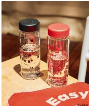
商品名：【Jagabee】ウォーターボトル 価格：1,650 円（税込） カラー展開：ブラック／レッド

容量 500mlの持ち運びしやすいウォーターボトル。夏を楽しむ「ポッタ」がプリントされた、LEPSIMオリジナルデザインです。