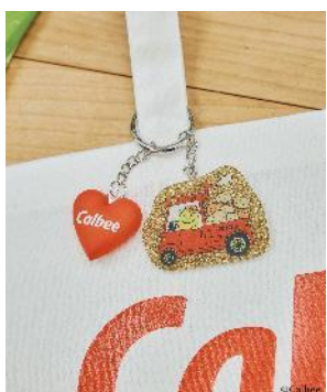
商品名：【Jagabee】アソートチャーム 価格：1,320 円（税込） カラー展開：トラック／じゃがいも

キラキラのラメとハートのCalbeeシリコンチャームがセットになったアソートチャーム。バッグなどのアクセントにもおすすめです。