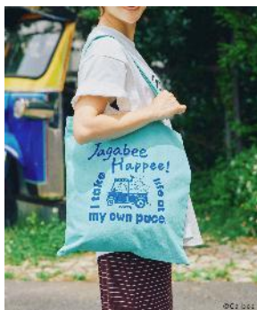
商品名：【Jagabee】アソートトート 価格：2,200 円（税込） カラー展開：Jagabee／オフホワイト／ピンク／ブルー／ブルー×イラスト／ブラック（WEB限定）

A4 サイズが入る使いやすいトートバッグです。「ポッタ」のアソートイラスト、Jagabee、Calbeeのロゴがポイントになっています。