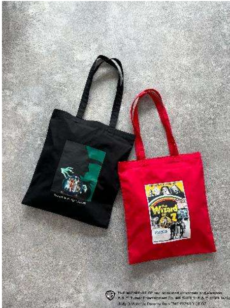
商品名：【KIDS】OZU／トートBAG 価格：3,300 円（税込） カラー展開：レッド、ブラック

ポリエステル素材で、大小サイズの違うポーチがセットになったマルチポーチ。トラベルポーチとしても、小物入れやおむつ入れなど、いろんな用途に使用できる万能アイテムです。カラーは、総柄のほかに T シャツと同じアートを施したデザインとの 2 色展開です。ポップなカラーリングが目を惹き、持っているだけで気分を上げてくれます。