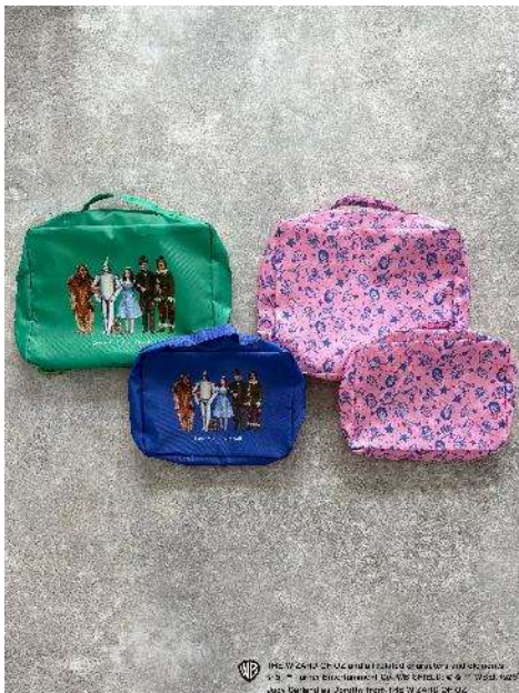
商品名：【KIDS】OZU／マルチポーチ 2P 価格：3,300 円（税込） カラー展開：ピンク、ブルー×グリーン

ポリエステル素材で、大小サイズの違うポーチがセットになったマルチポーチ。トラベルポーチとしても、小物入れやおむつ入れなど、いろんな用途に使用できる万能アイテムです。カラーは、総柄のほかに T シャツと同じアートを施したデザインとの 2 色展開です。ポップなカラーリングが目を惹き、持っているだけで気分を上げてくれます。