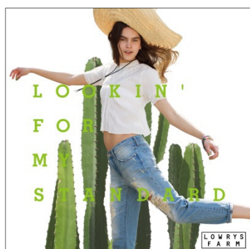
LOWRYS FARM ローリーズファーム ターゲット：20～30 代の女性 国内店舗数：141 店舗 （15 年 7 月末）