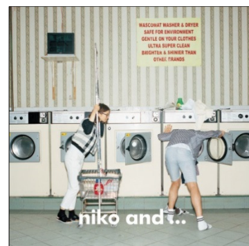
niko and ... ニコアンド ターゲット：25～35 歳の男女 国内店舗数：119 店舗 （15 年 7 月末）

その他スタディオクリップ、レプシムローリーズファームなど全 20 ブランドを展開しています。