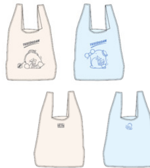
商品名：キャンバストート カラー展開：イエロー、ブルー 価格：¥2500(税抜)