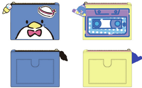
商品名：パスケース カラー展開：イエロー、ブルー 価格：¥1900(税抜)