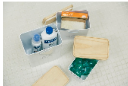
ランドリーコンテナS：¥1600+税 / ランドリーコンテナM：1900+税 / ランドリーコンテナL ¥2900+税