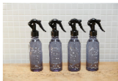
左写真：リードディフューザー：¥800+税 / 右写真：エアーフレッシュナー：¥800+税