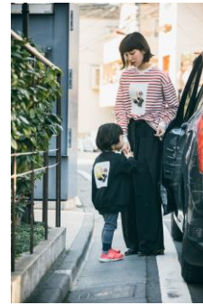
商品名:HARE×加賀美健×長谷川有里 ボーダーT カラー：レッド、ブラック 価格：¥6,000+tax（レディース）