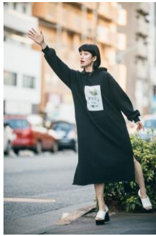
商品名:HARE×加賀美健×長谷川有里 ワンピース カラー：グレー、ブラック 価格：¥8,500+tax（レディース）