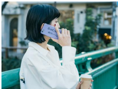
商品名:HARE×加賀美健×長谷川有里 iPhoneケース カラー：パープル、ホワイト 価格：¥2,700+tax