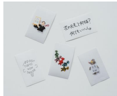
商品名:HARE×加賀美健×長谷川有里 ステッカー 価格：¥800+tax