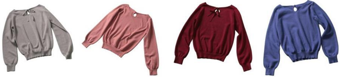
“イエローベース” ニット 4 色