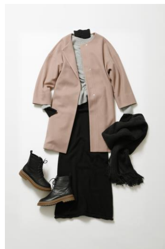
niko and ...

コート ¥7,900 ニット(ブラック) ¥4,500 ニット(ライトグレー) ¥3,900 スカート ¥4,900 ブーツ ¥5,900 ストール ¥3,300