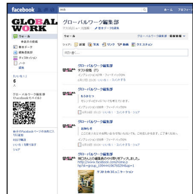
<Facebook ページ イメージ>