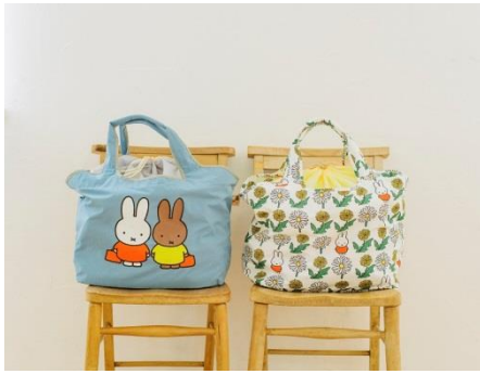
カゴエコバック 各¥2800+税