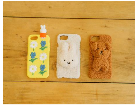
シリコンモバイルケース ¥2000+税 ふわふわモバイルケース 各¥2800+税