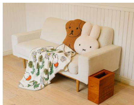
シルエットクッション 各¥2800+税 ブランケット ¥3200+税 ダストBOX ¥4500+税