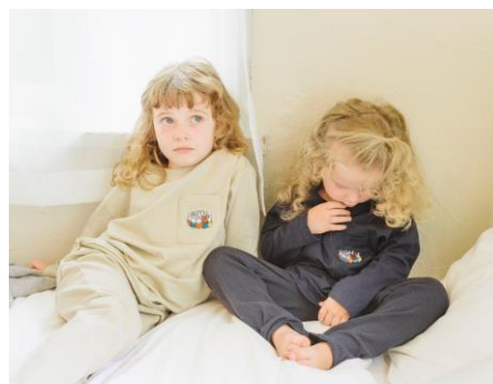
キッズルームウェア 各¥5990+税 (WEB限定)