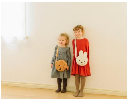
ポアショルダーバッグ 各¥2700+税 ※8月13日発売予定