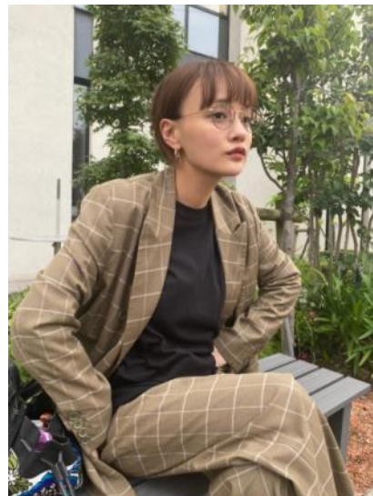
<チェックセットアップ>