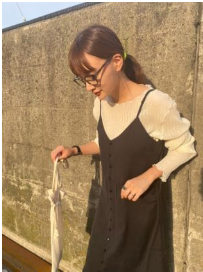
<3 ピースセットワンピース>

公式Instagram : http://www.instagram.com/m_nort.official/