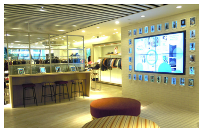
コレクトポイント原宿 2階・ラウンジスペースのサイネージで体験できます。