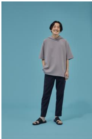
商品名：エアクッションパーカー半袖 価格：¥ 4,950（税込）

特設サイトには、各アイテム別のサイズチャートコンテンツを展開しています。 お父さんに近いスタッフ着用画像を見ていただくことで、サイズ選びの参考にいただけます。