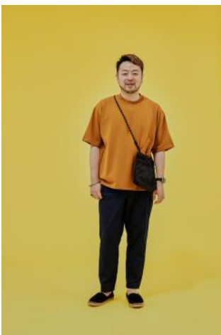
商品名：エアかるイージーパンツ 価格：¥ 4,290（税込）