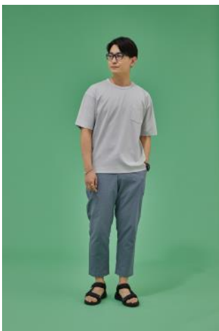
商品名：抗菌クリーンT e e半袖 価格：¥ 3,190（税込）