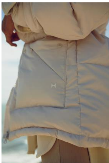
ダウンコート ¥38,500 / 中に着ているブルゾン ¥9,900 / ブラキャミソール ¥7,150 / レギンス ¥7,590