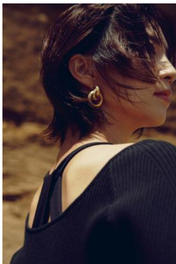
ニット ¥7,700 / 中に着ているブラランク ¥7,590 / スカート ¥11,000