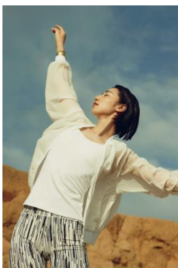
【BENAさんキービジュアル着用アイテム(ダンス)】