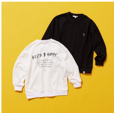
コラボスウェット (オフ、ブラック)