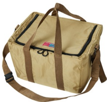
グロッサリーバッグ ¥4,400 (税込) カラー展開：ベージュ サイズ：W22cm×H19cm×D19cm