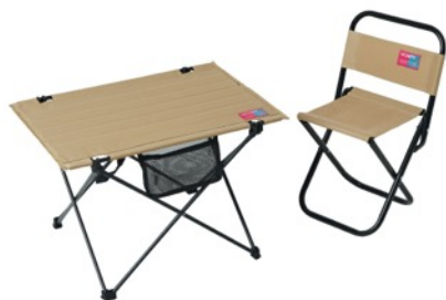
(左) オリタタミテーブル ¥7,150 (税込) カラー展開：ベージュ サイズ：W55cm×H37cm×D41cm (右) オリタタミチェア ¥2,640 (税込) カラー展開：ベージュ サイズ：W30cm×H40cm×D24cm