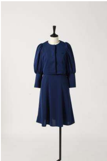
春夏の制服（ジャケットスタイル）