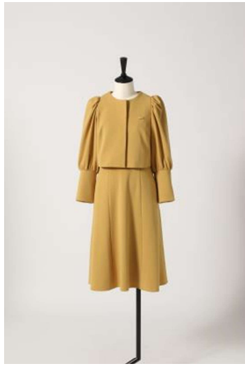
秋冬の制服（ジャケットスタイル）