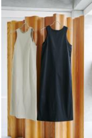
商品名：アメリロングワンピース サイズ：フリーサイズ カラー：ベージュ、ブラック 価格：¥7,700(税込)

潔く肩を見せるアメリカンスリーブ、体のラインを拾わない真っすぐなライン、光沢あるチノ素材のワンピース。細部へのこだわりこそが、同時に品よくヘルシーさを纏える理由。ストレッチ素材で動きやすく程よく肉厚。着心地抜群です。