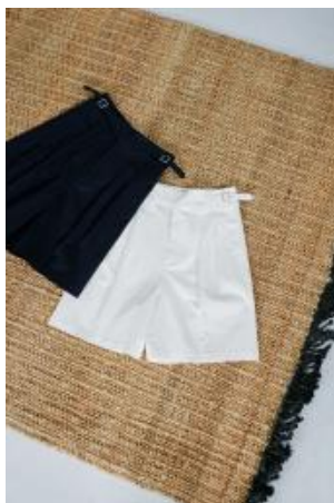
商品名：ベルトデザインハーフパンツ サイズ：S・M カラー：ネイビー、オフ 価格：¥5,940(税込)

きれいな光沢のあるチノ素材で、グルカパンツのディテールを施した1着。膝にやや重なる長めの丈とすっきりしたシルエットゆえ、着こなしやすい仕様です。シアーシャツやデザイントップスと合わせて、フェミニンカジュアルを楽しんで。