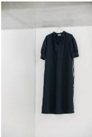
商品名：ウエストギャザーワンピース サイズ：フリーサイズ カラー：ネイビー、カーキ、オフホワイト 価格：¥8,250(税込)

ウエストギャザーのワンピースは両サイドの紐でシルエットのアレンジが可能。そのまま爽やかに、キュッと絞ってクラシカルに、表情豊かな1枚です。袖のタックやすっきり開いたデコルテなど、大人に似合う甘ディテールが心強い。