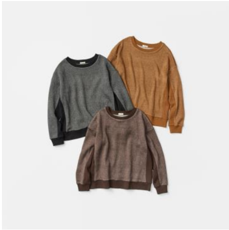
ヘリンボーン柄プルオーバー ¥4,400 - (税込)