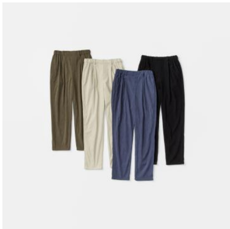
ボンタンパンツ ¥4,950 - (税込)