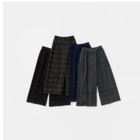
ドラムパンツ ¥5,500 - (税込)