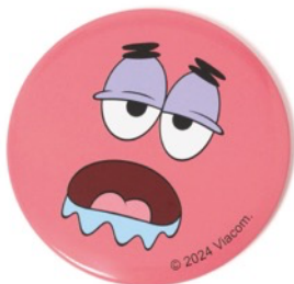
商品名：缶ミラー 価格： ¥550（税込） カラー展開：ピンク／イエロー サイズ：F