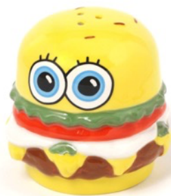
商品名：スパイスボトル 価格：¥1,760（税込） サイズ：なし